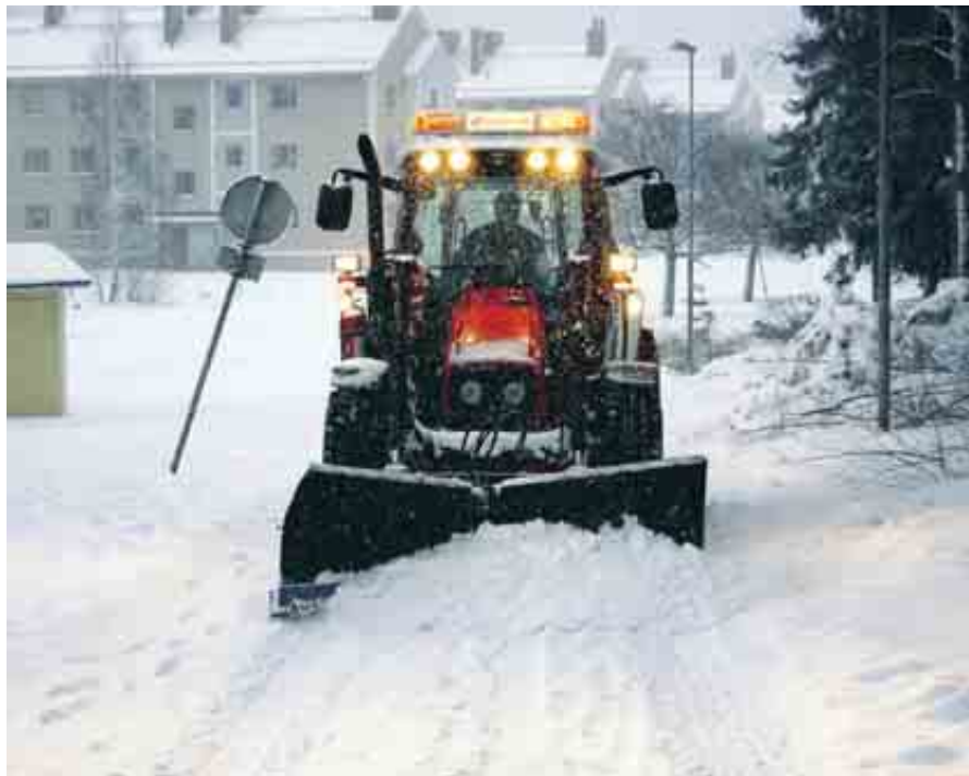
Snöröjning är en viktig syssla för Faxeholmens servicegrupp.

– Men har det fallit mer än fem centimeter snö på någon plats, kan någon av de entreprenörer vi har kontrakt med åka ut och snöröja utan att vi begär det.