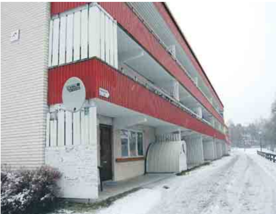
Nygatan i centrala Ljusne