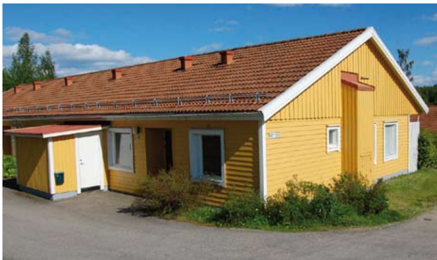
CD Ekmans väg i Bergvik.