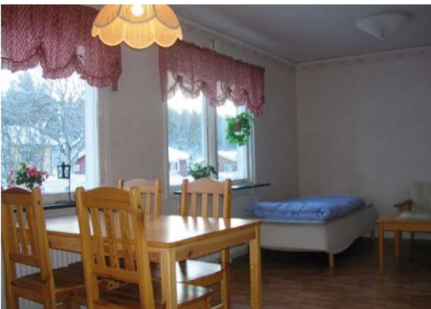
Lägenheterna är fullt möblerade och utrustade med allt som behövs för en trevlig och bekväm vistelse.

För att boka en lägenhet kontaktar du Faxeholmens uthyrning på telefon 729 30.