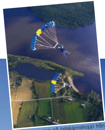
Varför inte prova på fallskärmschopp från Moheds flygfält?