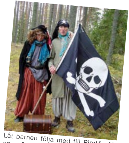
Låt barnen följa med till Piratön för en spännande dag med pirater och skattjakt.

Myccket mer finns att läsa i Söderhamns kommuns turistbroschyr, som finns utlagd på en rad platser och på kommunens hemsida, www.soderhamn.se . Där finns även turistbroschyren att ladda ner.