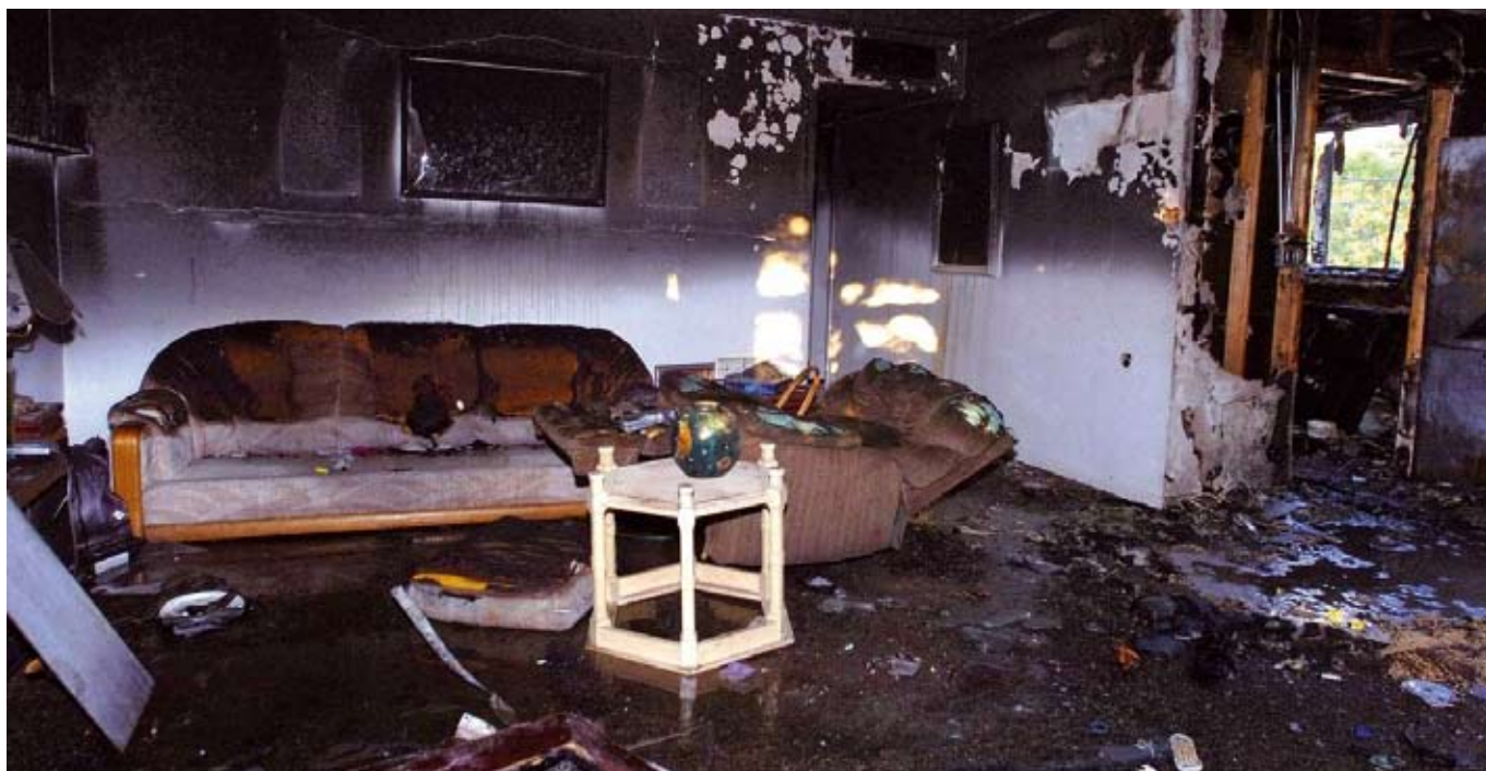
En felplacerad ljusstake kan ställa till med stor förödelse.