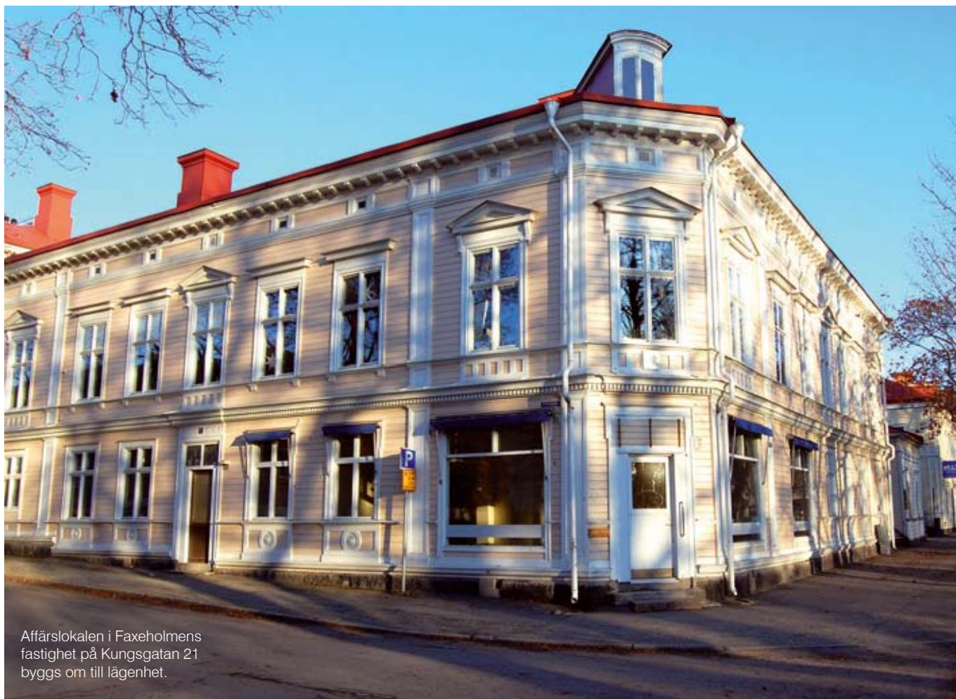
Affärslokalen i Faxeholmens fastighet på Kungsgatan 21 byggs om till lägenhet.