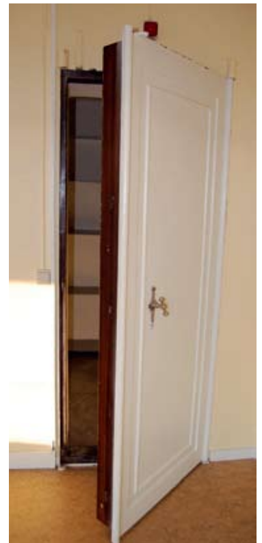
En trevlig detalj i den nya lägenheten blir det gamla kassavalvet som kan fungera som skafferi.