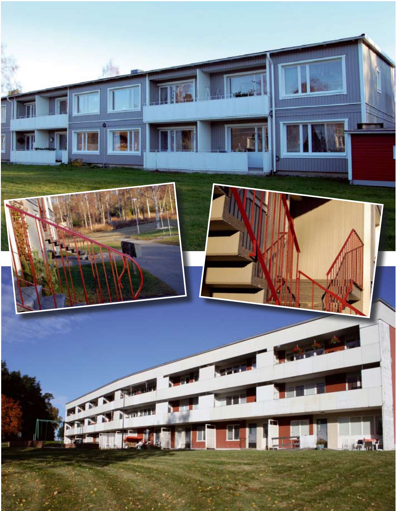
Hammarvägen i Söderala är nästa område som kommer att få en ansiktslyftning.