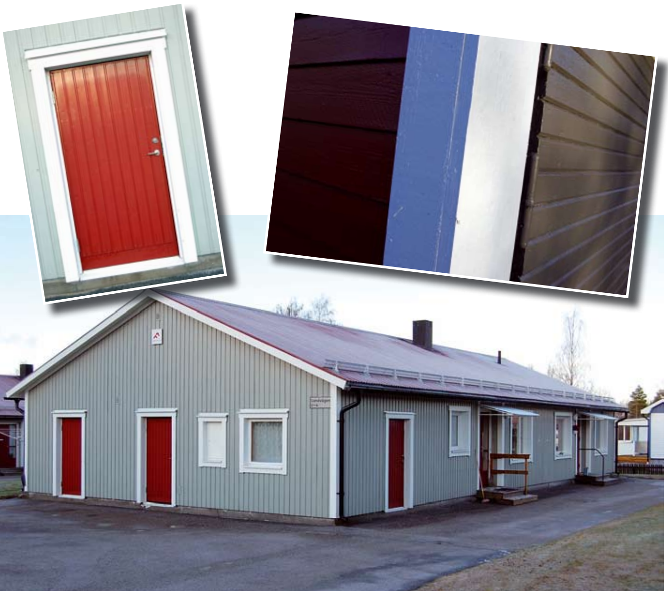
Trekanten i Stråttjärna och Skiljarvägen i Ljusne har fått modern färgsättning på fasaderna med färgrika detaljer.

Förutom fasadrenoveringar kommer Faxeholmen att se över cykelrummet som ska få nytt tak.